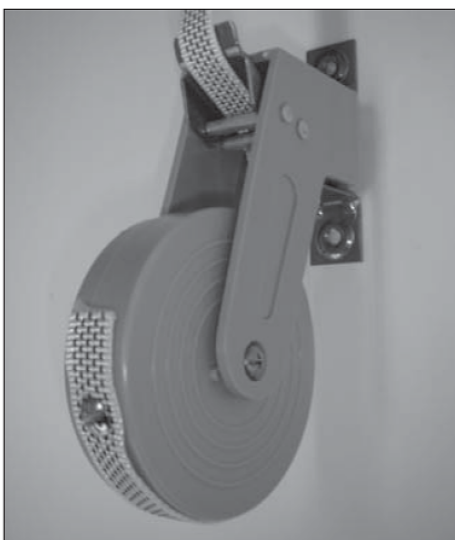
Schroef nu het schroefje met het band op de spoel.