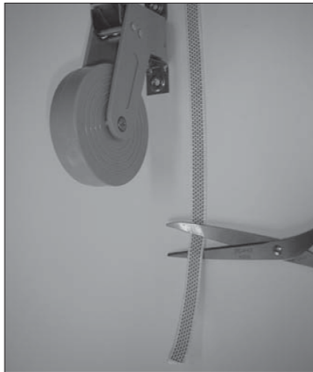
Knip het band \pm 25 cm voorbij de bandopwinder af.