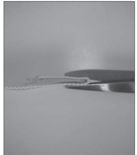
Vouw het uiteinde dubbel en knip het uiteinde van het band in.