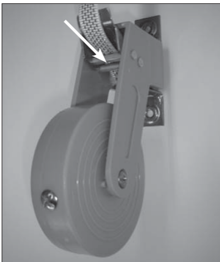
Voer het band over de 2 stuks cilinders door de rem.