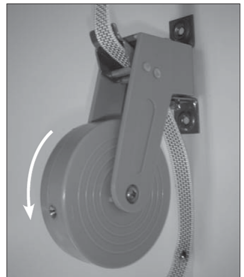
Draai de veer voldoende op spanning. Houdt deze spoel goedvast i.v.m. de grote veerspanning.