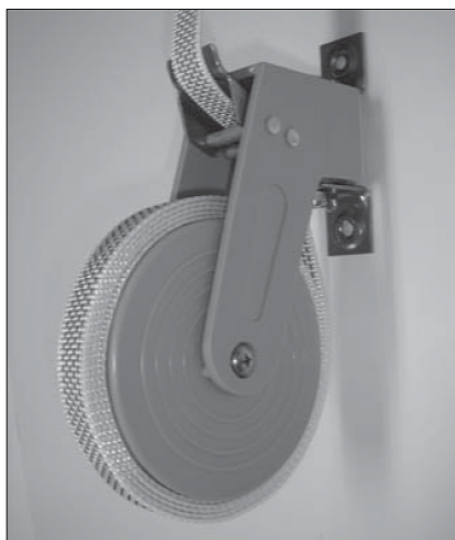
Laat nu rustig de veer afrollen.