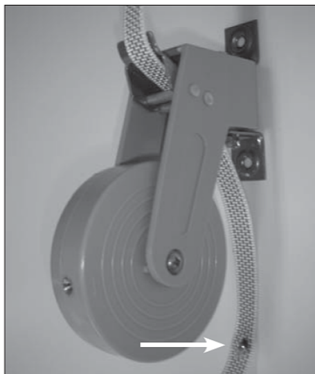
Plaats het schroefje door het in geknipte band.