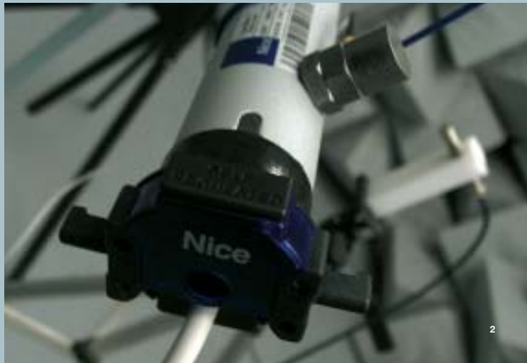
2 Controle in de akoestische kamer van de vibraties die afgegeven worden door de buismotor