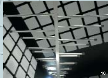
17 - 18 - 19 Antenne voor EPR-emissieproeven in semi-anechoïse kamer