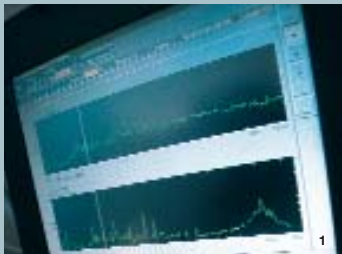
1 Controle in akoestische kamer - grafiekdetail op externe pc die in contact staat met de kamer