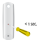
Programmeer kanaal 1